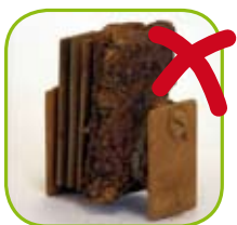
com produtos de baixo custo

O uso de anticongelantes-refrigerantes de duvidosa qualidade põe em perigo o circuito de refrigeração do seu motor. A avaria mais frequente é a da "junta da cabeça do motor".