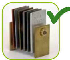
com líquido de refrigeração OLIPES

Resultados de corrosão multimetal em ensaio de corrosão ASTM 1384 realizado em laboratório